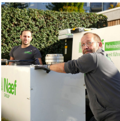
Appareils pour l'assainissement avec ANROSAN