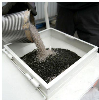
Mélange abrasif adapté aux besoins

à chercher des solutions, et c'est là que j'ai eu l'idée d'assainir les conduites concernées 2 en les sablant par l'intérieur, puis en les dotant d'un nouveau revêtement. Il m'a fallu d'innombrables essais pour arriver enfin à des résultats acceptables. J'avais mis les pieds sur un continent totalement inexploré, et j'ai même dû concevoir et fabriquer les appareils et machines nécessaires à la réalisation des essais. Grâce au soutien d'un ami chimiste, j'ai malgré tout réussi à élaborer une formule efficace pour produire le revêtement à base d'époxy. Cette formule a été acceptée en 1987 par l'OFSP dans le cadre d'une utilisation dans les conduites d'eau potable. A mon propre étonnement, les premières demandes de licences ont vu le jour simultanément, alors même que nous n'avions pas encore réalisé