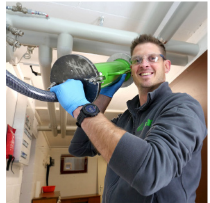
Machines pour l'assainissement avec le HAT-System | Collaborateur en train de sabler et qui, ensuite, procédera à l'injection des serpents.

chantiers n'étaient jamais les mêmes. Chaque objet était, pour ainsi dire, un cas particulier.