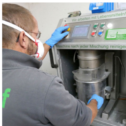
Remplissage du mélangeur-doseur