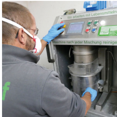
Remplissage du mélangeur-doseur