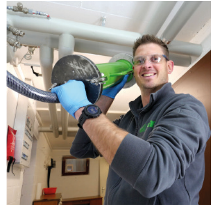
Machines pour l'assainissement avec le HAT-System | Collaborateur en train de sabler et qui, ensuite, procédera à l'injection des serpents.

chantiers n'étaient jamais les mêmes. Chaque objet était, pour ainsi dire, un cas particulier.