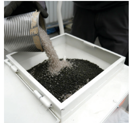
Mélange abrasif adapté aux besoins

à chercher des solutions, et c'est là que j'ai eu l'idée d'assainir les conduites concernées 2 en les sablant par l'intérieur, puis en les dotant d'un nouveau revêtement. Il m'a fallu d'innombrables essais pour arriver enfin à des résultats acceptables. J'avais mis les pieds sur un continent totalement inexploré, et j'ai même dû concevoir et fabriquer les appareils et machines nécessaires à la réalisation des essais. Grâce au soutien d'un ami chimiste, j'ai malgré tout réussi à élaborer une formule efficace pour produire le revêtement à base d'époxy. Cette formule a été acceptée en 1987 par l'OFSP dans le cadre d'une utilisation dans les conduites d'eau potable. A mon propre étonnement, les premières demandes de licences ont vu le jour simultanément, alors même que nous n'avions pas encore réalisé