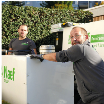
Appareils pour l'assainissement avec ANROSAN